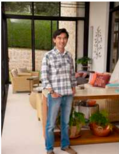
Créditos informações: Revista Cenário e Jornal do Pintor

Em toda edição, a ACIAS apresenta o estabelecimento comercial ou local de trabalho de cada membro da diretoria, que se dedica, de forma totalmente voluntária, em prol de mais desenvolvimento, união e prosperidade do nosso comércio e da nossa cidade. Confira!